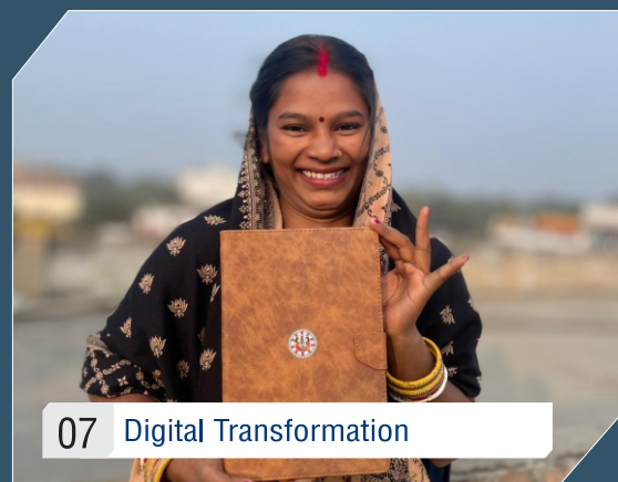
07 Digital Transformation