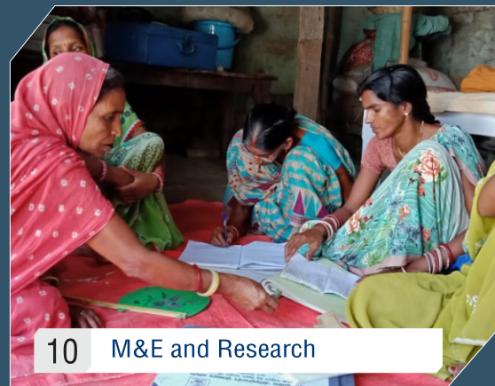
10 M&E and Research