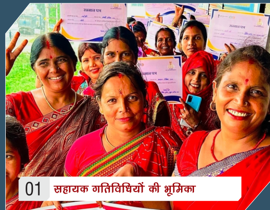
01 सहायक गतिविधियों की भूमिका