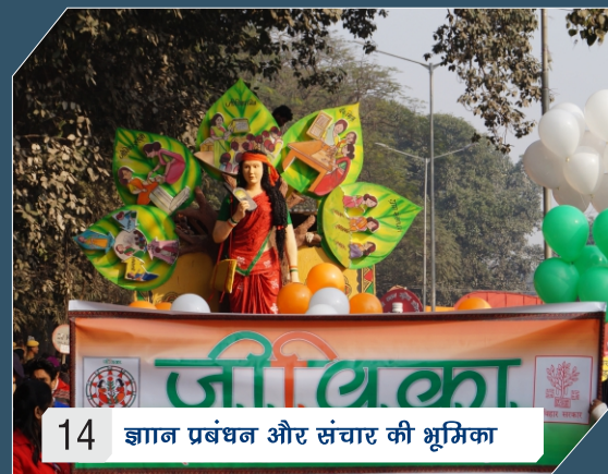
14 ज्ञान प्रबंधन और संचार की भूमिका